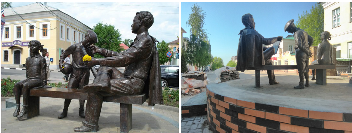
Рис. 1, 2. Реконструкция памятника Н. Жукову. Елец, май 2019 года

Нет сомнений, что такая спешка порождает ситуации эстетического диссонанса ввиду попытки связать прошлое с новыми трендами. Так произошло с памятником советскому художнику Н. Жукову, открытому в 2003 году. Сегодня творчество Жукова вполне вписывается в патриотический тренд. При подготовке к празднованию 9 Мая рассыпавшееся от времени основание памятника, которое в свое время было сделано из итальянского мрамора, обложили плиткой, имитирующей гвардейскую ленту. Власть посчитала эту меру адекватной тщательной реставрации и сохранению памятника в версии создателя — скульптора А. Таратынова.