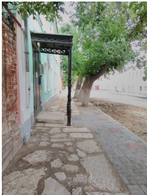
Рис. 5. Реконструкция мостовой. Комбинация известняковых плит и современной плитки. Патронат городской администрации. Елец, 2019 год