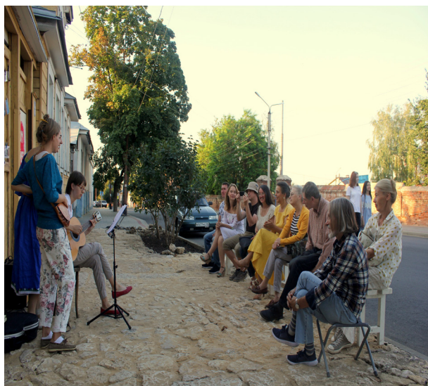
Рис. 4. Завершение сезона реконструкции. Частная инициатива без поддержки администрации. Дом Новосельцевых. Елец, 2018 год

Городскую власть часто упрекают в антиэстетизме, причина которого в дистанцировании от процесса интеллектуальных сил сообщества. Возможно, именно подобный подход со стороны городской администрации стал предметом критики врио Липецкой области И. Артамонова, периодически инспектировавшего елецкие стройки. Главу города Сергея Панова тогда упрекали в том, что в Ельце якобы «все делают по-деревенски» 13 . Видимо, это и послужило причиной смены главы Ельца в июле 2019 года, когда вместо Панова был назначен Евгений Боровских. Как раз в тот момент, готовясь к губернаторской кампании, И. Артамонов поменял ряд глав муниципалитетов. Назначение Боровских имело еще и гипотетические цели культурного преобразования города, поиска сюжетов, позволяющих по-новому представить городское пространство. Замысел состоял в том, что молодой политик (пусть и «варяг») лучше справится с этой задачей, нежели прежний мэр, являющийся заложником консервативной среды и длительное время не обновлявший администрацию 14 .