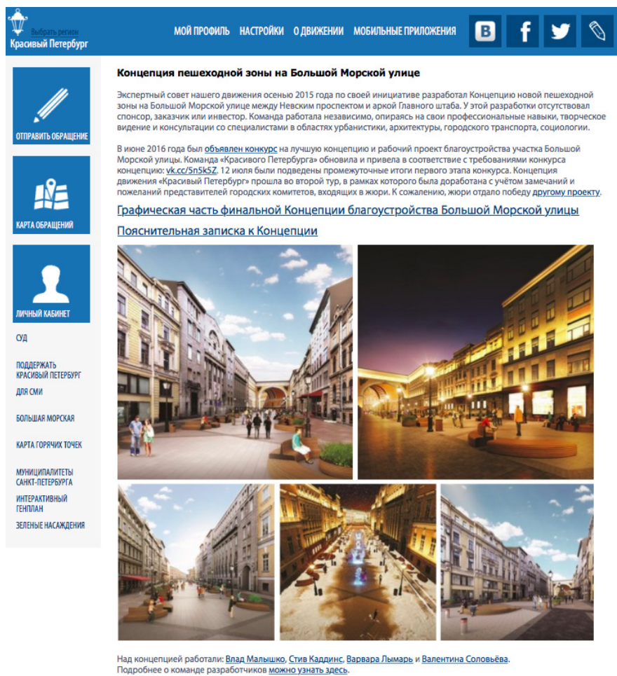
Рис. 2. Проект, созданный гражданской группой 1