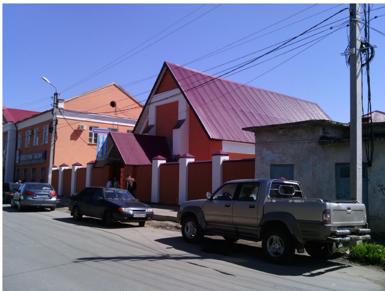
Рис. 6. Елец. Протестантская кирха сегодня

Только за 2019 год в Ельце разрушилось сразу нескольких важных объектов, создающих ощущение уникального культурного поля русской провинции конца XIX века. Такое ощущение, что утрачивание архитектурной среды происходит по нарастающей,