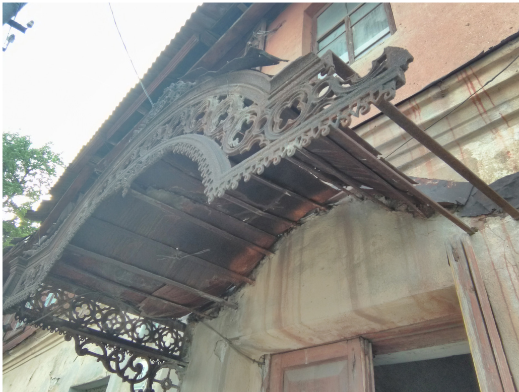
Рис. 7. Май 2019 года. Чугунное крыльцо бывшего дома нотариуса Барченко