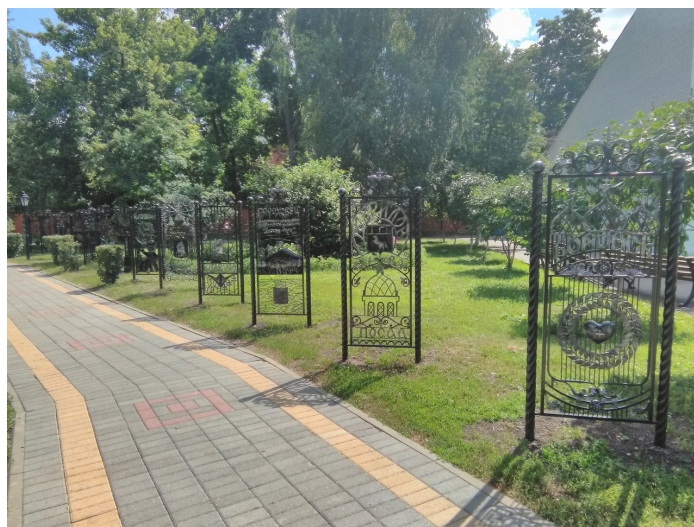
Рис. 3. Аллея малых городов в городском парке. Елец, июль 2019 года

влияния. Пропагандистский дискурс предполагает со стороны официальной культуры элементарное «занятие места. Чтобы другой не было» [Неизвестный, 1991, с. 38]. Поэтому в практиках коммеморации в провинциальном Ельце можно обнаружить некую методичность и тотальность. Вопрос целесообразности и эстетики оказывается вторичным по сравнению с необходимостью сиюминутной демонстрации торжественного момента открытия. Искусение запечатлеть себя в объективах камер оказывается выше необходимости поддержания исторической среды в надлежащем состоянии. Этот конфликт приводит к невразумительным наслоениям памяти, их гибридному, нелепому скрещиванию. Так, в начале июля в Ельце в рамках Пятого фестиваля малых городов в городском саду была открыта Аллея малых городов России с рядом металлических указателей. При этом самой властью постоянно подчеркивается аутентичность пространства городского — бывшего дворянского — парка и уникального ботанического сада, о котором писали И. Бунин и М. Пришвин. Теперь установленные таблички соседствуют с чугунным фонтаном конца XIX века и известняковым гротом с беседкой и чашей фонтана, напоминающей контурами Черное море.