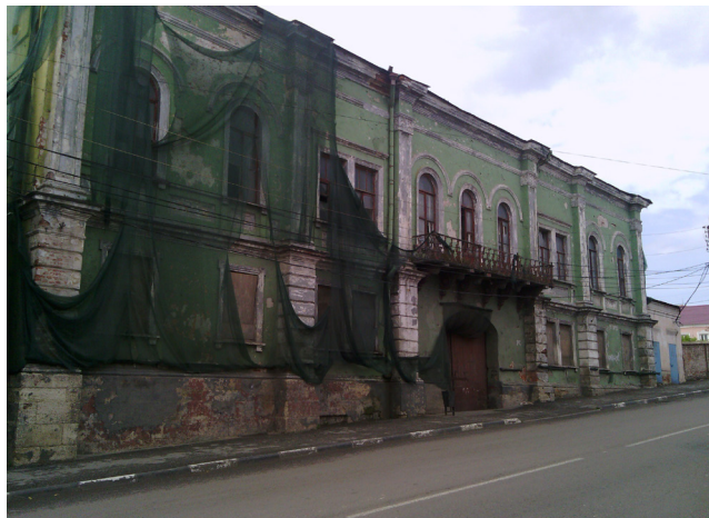
Рис. 8, 9. Разрушающиеся здания в центре Ельца, 2015 год