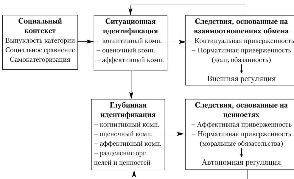
Сокращенный вариант интегративной модели процессов идентичности и приверженности (Meyer et al., 2006, p. 669)