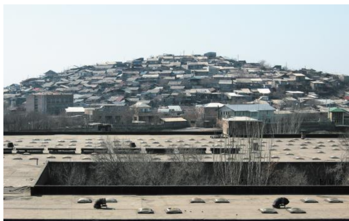
Общий вид вернакулярного района Норагюх. На переднем плане — фрагмент модернистского здания 1970-х гг. Фото автора, 2013.

Наконец, это демократичная и «честная» среда, адекватная реальным возможностям