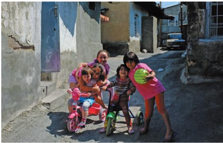
Девочки на улице Конда. Фото автора, 2012.