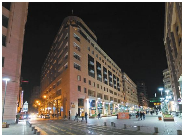
Северный проспект ночью. Фото автора, 2015.

Но получилось нечто иное, гибридное: активно посещаемое публичное пространство улицы-молла с роскошными бутиками и кафе, устроенными в первых этажах практически не обитаемых элитных жилых высоток. Здания здесь несомасштабны окружению и одеты либо в упрощенный «неоармянский» декор, либо в угловатый, резкий пост-постмодерн. В них нет ни глубокой культурной рефлексии, ни формальных находок, присутствующих лучшим произведениям армянского зодчества вплоть до 1980-х гг.