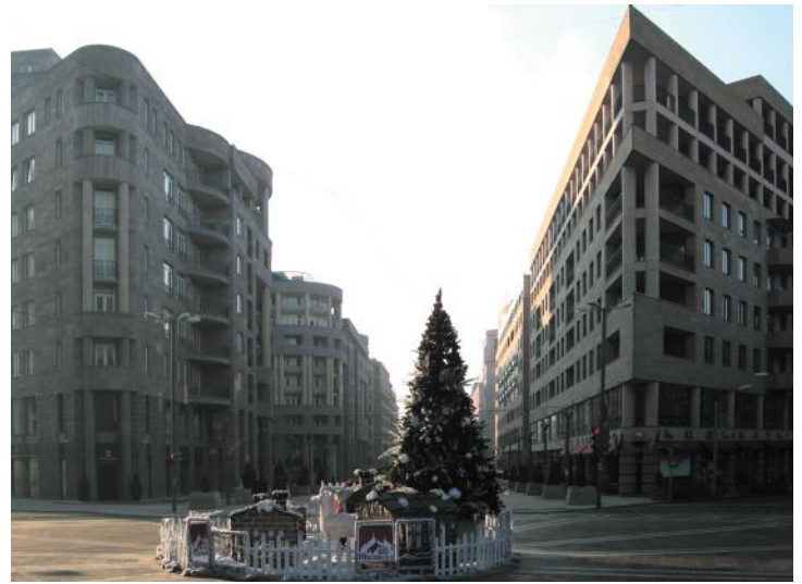
Общий вид Северного проспекта.