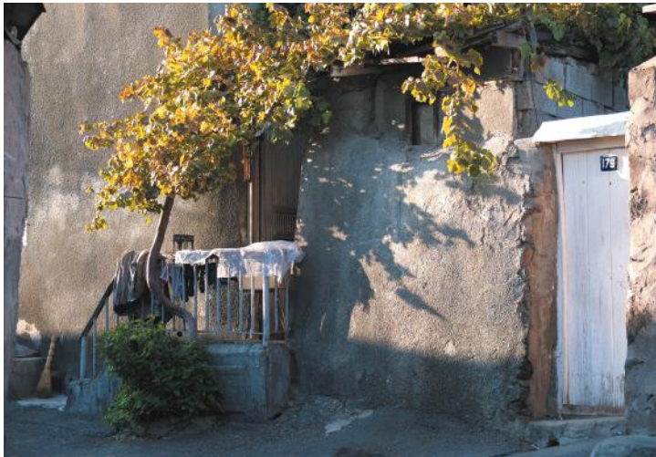
Фрагмент среды вернакулярного района Конд. Фото автора, 2015.