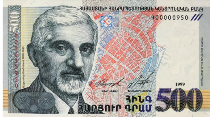
Портрет А. Таманяна и схема генплана Еревана 1924 г. на 500-драмовой купюре, вышедшей из употребления.

В творчестве Таманяна совпало, казалось бы, несочетаемое: модернистский подход к истории места 8 и стремление к созиданию нового на основе древних национальных прототипов. Но это кажущееся противоречие. Для настоящего визионера равно допустимо и игнорирование, и изобретение реальности. И рана, нанесенная Таманяном городу, до сих