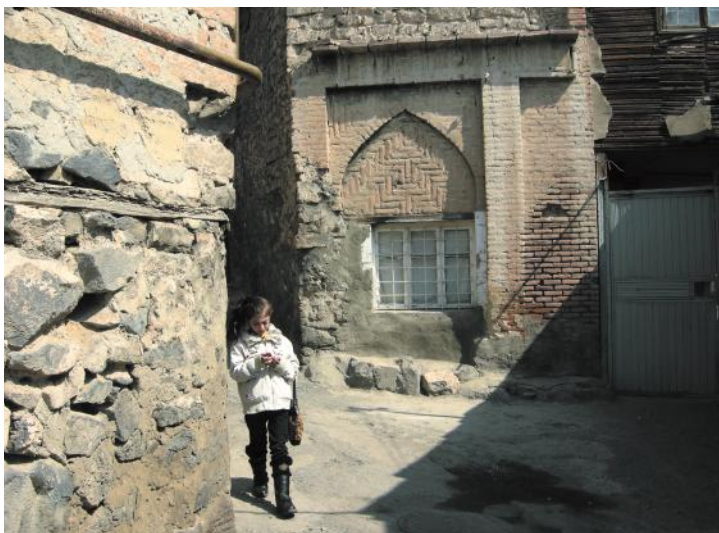
Конд. Стрельчатая арка и фигурная кладка — характерные детали местного вернакуляра. Фото автора, 2012.

ее обитателей, не допускающая характерных для сегодняшнего Еревана чрезмерных «понтов» и пускания пыли в глаза.