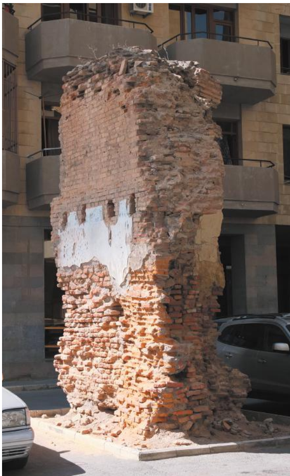
Последний пилон мечети на территории бывшей Эриванской крепости. Фото автора, 2013.