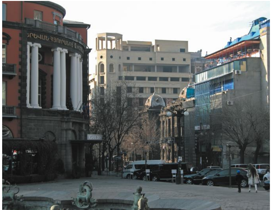
Ереванский микст: улица Абовяна. Фото автора, 2012.

Второй Ереван. В 1828 г. город обнаружил себя периферийным административным центром Российской империи, а в конце XIX в. уже пробовал стать «европейским»: в позднеимперской Эривани появляются зачатки модернити. Вот только собственно армянские культура и бизнес процветали не здесь. Упрочиться, нарастить городские «мускулы», достичь состояния неотъемлемости городу не дала, среди прочего, ориентация активного армянства на центры силы, расположенные вне Армянского нагорья — Тифлис, Баку, Константинополь, Санкт-Петербург. И все же в это время успели оформиться «раскрашенные львом» 5 разноцветно-туфовые центральные улицы губернской столицы, и сложились поблизости разноязычные вернакулярные районы и кварталы — Конд, Фирдуси и др. Сегодня эти срединные слои урбанистического пи-