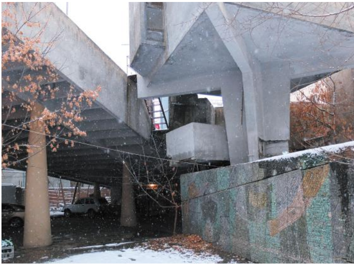
Летний зал кинотеатра «Москва» (архитекторы С. Кнтехцян и Т. Григорян, 1967) со стороны ул. Туманяна. Фото автора, 2012.

Своего рода бонус архитектуры модернизма в том, что она, в отличие от вернакулярной, может быть сохранена в той же «вертикальной» парадигме, в коей и создавалась (целевые программы реставрации памятников, комплексная реконструкция массивов застройки 14 ). Это все та же «сильная» проектность, привычная нашим градостроителям. Вот только для ее применения нужны понимание ценности такого наследия наверху (властная воля), немалые бюджетные средства и, как ни странно, общественное давление «снизу».