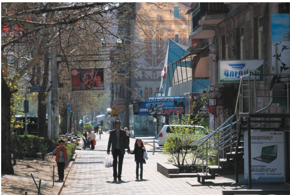
Улица Саят-Нова.

ко пугать, но и пытаться кормить. Сразу решили, что когда деревья начнут плодоносить, рвать с них фрукты разрешено будет только детям. <...> Люди чувствовали себя по-новому, радовались, и были удивительно едины — от мала до велика. <...> Этой улице, этой радости предстояло сыграть огромную роль в становлении образа Еревана и образа ереванца. Эта роль, может быть, была даже большей, чем роль плана Таманяна, хотя последний гораздо более известен [Лурье, 2007].