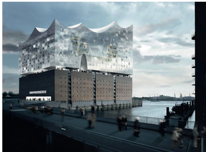
Фото © Herzog & de Meuron