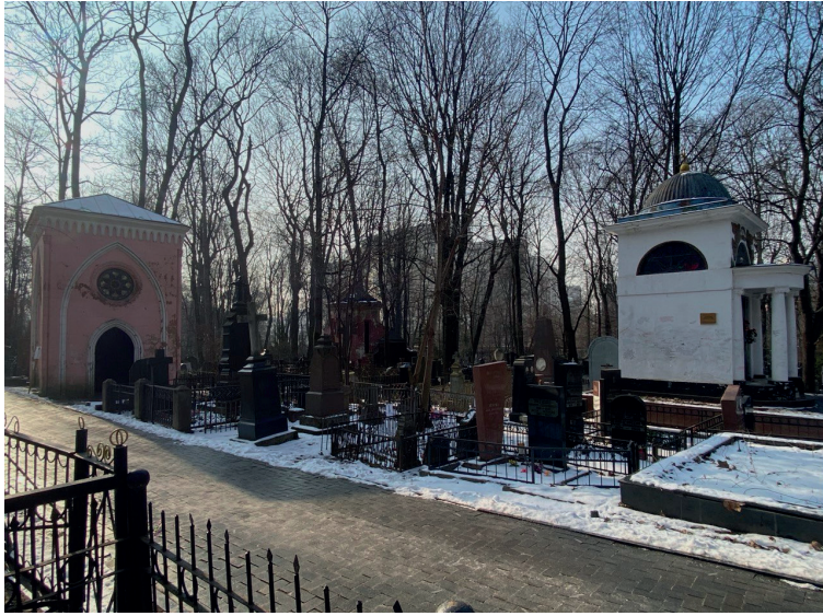
Рисунок 1. Мавзолей княгини Волконской (слева) и мавзолей Эрлангеров (справа)

цией (места исполнения желаний) предполагает значительное пересечение аудиторий и, как следствие, сходство в тематике надписей [Громов, 2023]. Этой гипотезе, однако, противоречит факт наличия уникальной формы обращения к Эрлангерам, что может служить маркером особого символического статуса их мавзолея и тематических расхождений.