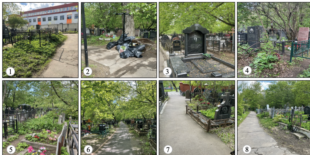
Рис. 6. Положительно воспринимаемые объекты