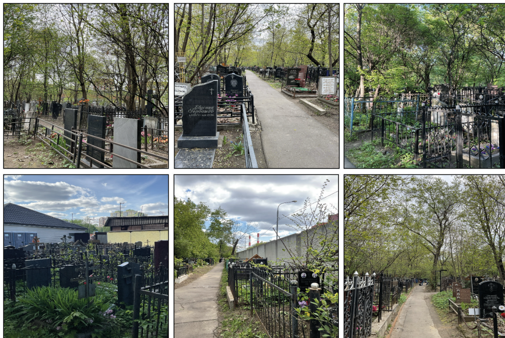
Рис. 4. Однообразность и скученность пространства