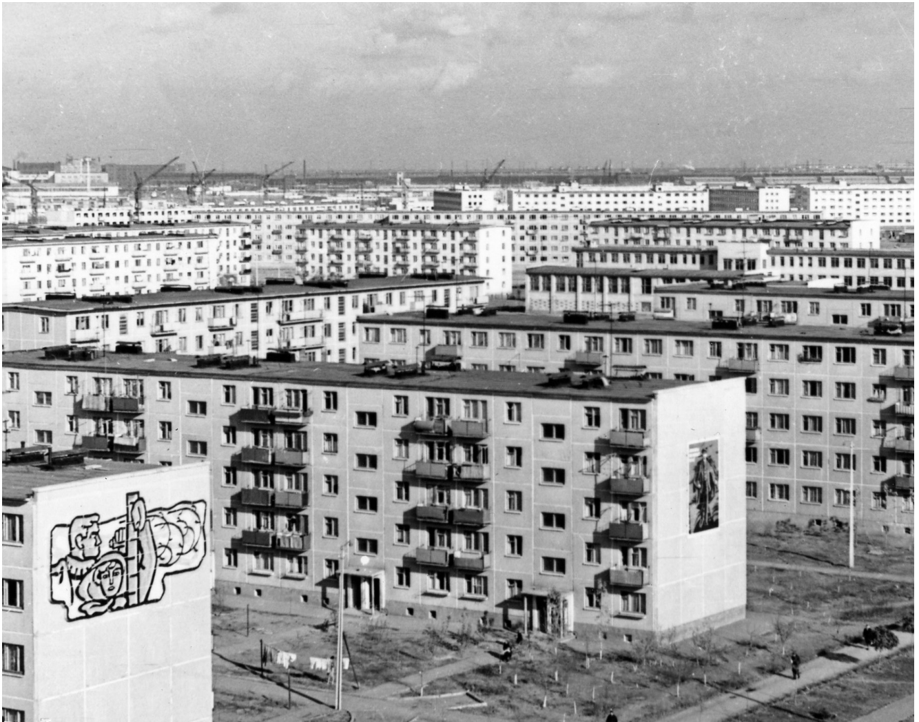
Рис. 4. Новые микрорайоны молодого промышленного города Волжского, 1963 год

наследия по вопросу сохранения мозаичных панно сводится к единственному тезису. Их нужно сохранять, потому что это яркий материальный символ советской эпохи, наше видимое и подлинное наследие, такое же значимое, как древнерусский собор, дореволюционный купеческий особняк или конструктивистская фабрика-кухня. Но наличие исторической ценности – слабая гарантия сохранения объекта культурного наследия в наши дни. Чтобы выйти из состояния городской «безделушки», в котором советская мозаика фактически пребывает последние несколько десятилетий, нужно нечто большее. Но как советская городская мозаика может вновь стать общественной ценностью?