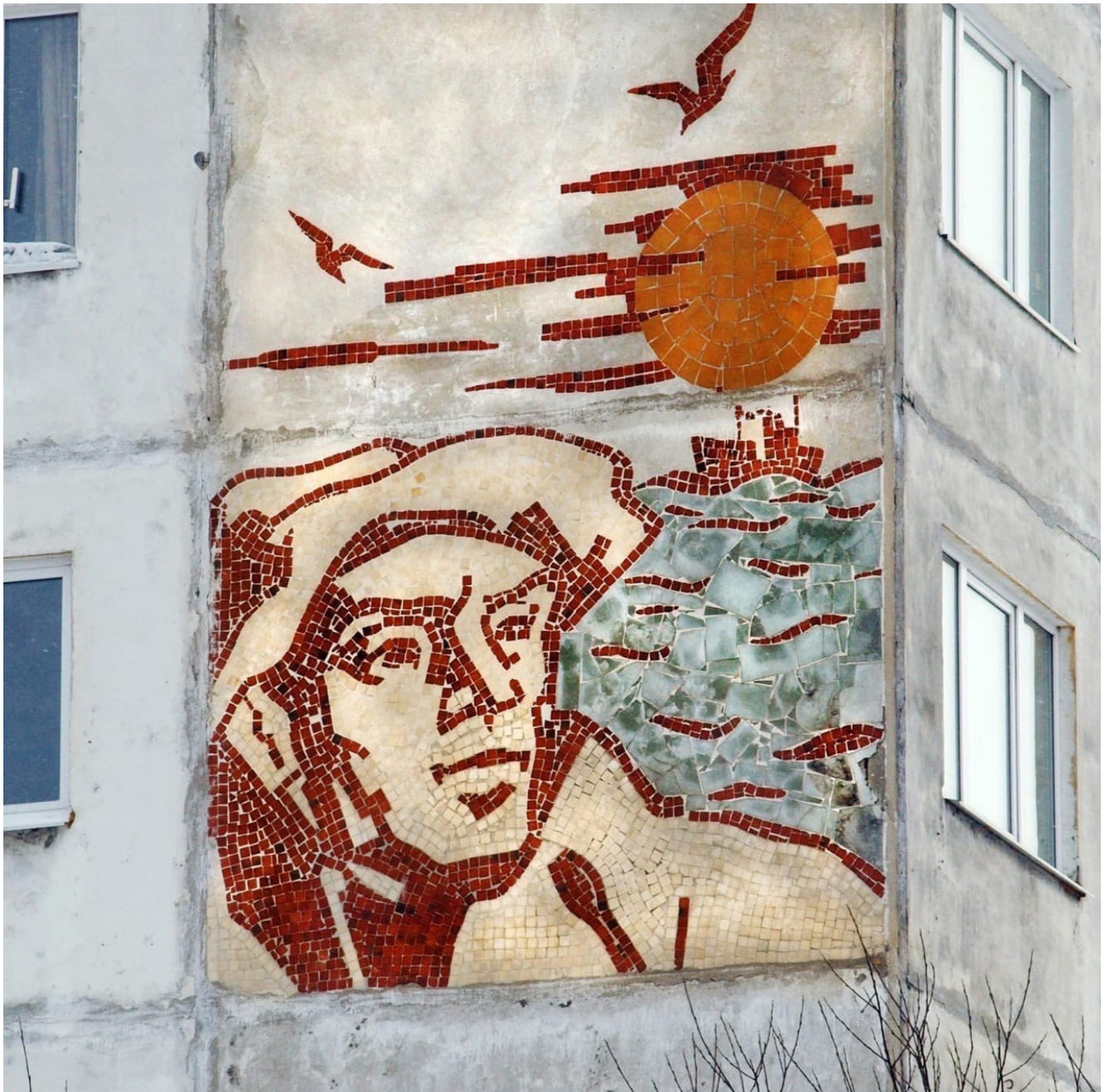
Рис. 8. Моряк-полярник на торце панельного дома в Мурманске

по себе становились инфоповодами, продвигавшими заведения в медиа [Откуда в модном кафе..., 2020; Спасенная с завода..., 2021; Посмотрите на спасенную с завода..., 2022].