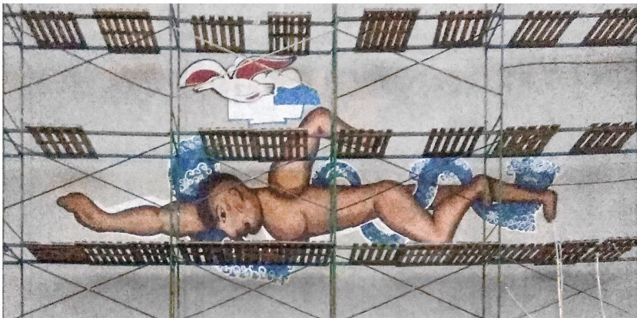
Рис. 2. Мозаичное панно «Пловец» до и после ремонта фасада здания

в единый стиль, которому должны соответствовать все постройки территории [На Восточном рынке..., 2017]. В аэропорту Кургана во время реконструкции рабочие сбили половину мозаичной стены, украшавшей зал ожидания [В Курганском аэропорту..., 2020]. Систематически уничтожаются мозаики павильонов автобусных остановок на междугородних трассах [Остановки с узором..., 2017; Область лишилась..., 2022], а жители панельных домов закрывают панно утеплителем [Во Владивостоке..., 2017; Улица Юбилейная..., 2020]. Это лишь малая часть потерь последних лет.