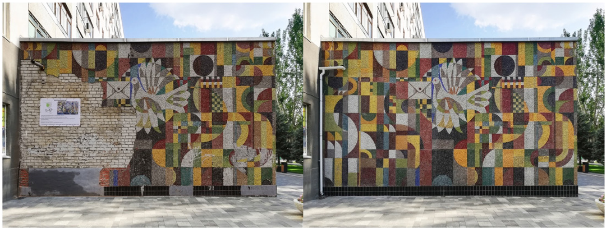
Рис. 6. Мозаичное панно «Связь» до и после реставрации

[Волжане..., 2023]. В 2021 году волгоградской творческой группой «Аксис» была восстановлена другая работа – мозаика «Связь» – одна из наиболее обветшавших мозаик города (рис. 6). Реконструкция прошла полностью за счет городского бюджета и под художественным надзором волжских монументалистов [На волжском тысячеквартирнике..., 2021].