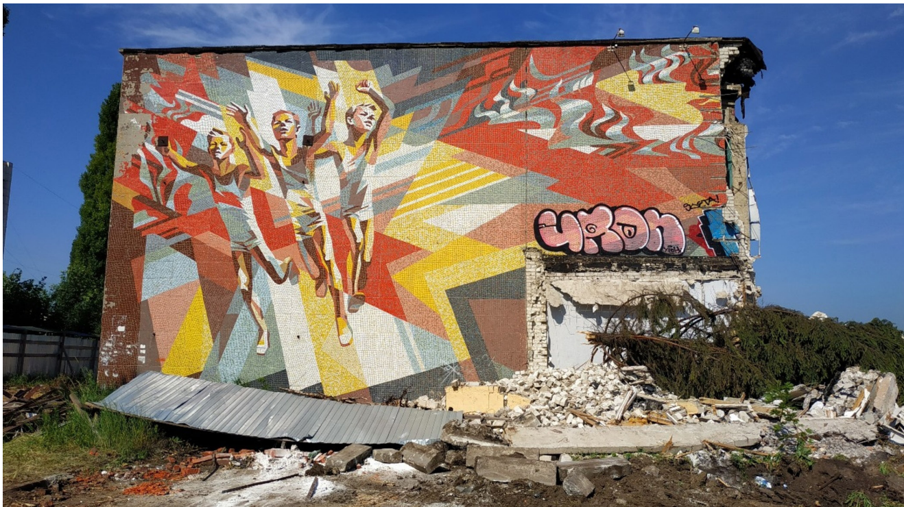
Рис. 1. Мозаичное панно «Бегущие в будущее», снесённое вместе со зданием детско-юношеской спортивной школы в Белгороде Источник: https://bel.ru/news/2019-06-10/v-belgorode-pytayutsya-spasti-mozaiku-na-rushaschemsya-zdani-sportshkoly-324477

Как правило, эти материалы касаются истории развития советской мозаики как декоративно-прикладного искусства, творческого пути и почерка конкретных художников-монументалистов или описывают мозаичное наследие отдельных городов. Авторы данных работ акцентируют внимание на значении сохранения советских мозаик, отсылая к их высокой исторической и художественной ценности. На практике же советская мозаика, несмотря на свою богатую историю, редко рассматривается как ценное наследие, достойное бережного отношения, а проблема сохранения подобных объектов продолжает оставаться острой. Между тем никакой содержательной дискуссии о том, как вывести их из нынешнего статуса «неценности», не ведется.