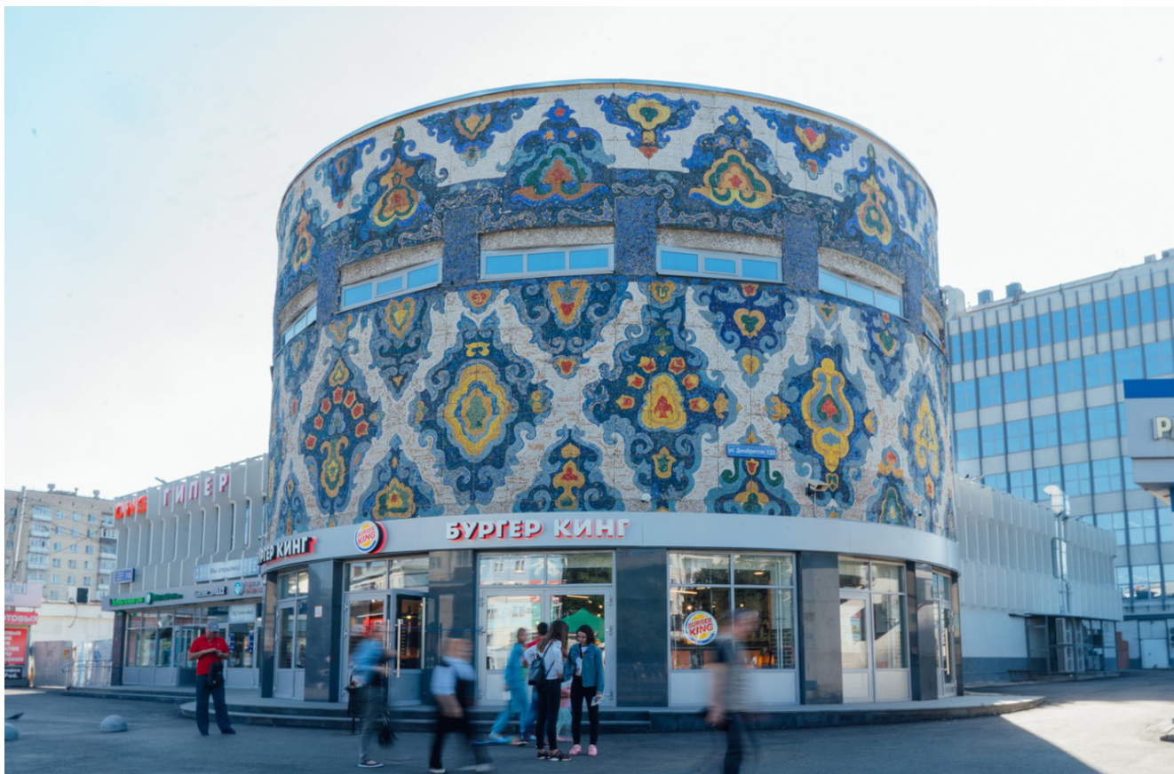
Рис. 7. «Тюбетейка»—знаковое для города сооружение и узнаваемый символ Московского района Казани

изображают атомные ледоколы, фигуры моряков Северного флота и полярных рыбаков, силуэт северного сияния (рис. 8) [Историческая мозаика..., 2023], а в Воркуте и окрестных поселках находятся панно с выложенными из смальты и керамики северными оленями на просторах тундры и ненцами в традиционной одежде (рис. 9) [Эпичные советские мозаики..., 2023].