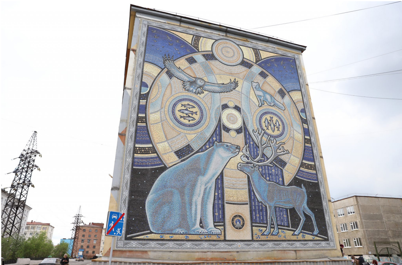
Рис. 11. Новое мозаичное панно «Солнце Арктики» в Норильске, где каждое животное полярных широт представляет один из районов города Источник: https://arnorilsk.ru/news/solnce-arktiki-vzoshlo-v-norilске