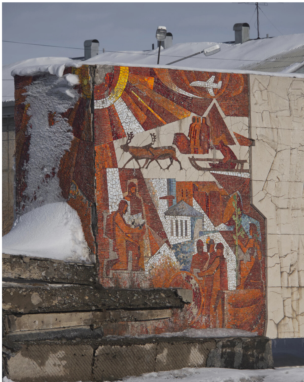
Рис. 9. Памятная стела-монумент в честь первоот- крывателей Печор- ского угольного бассейна в Воркуте

Норильска, учрежденной компанией «Норникель». Финансирование работ проводилось градообразующим предприятием [«Солнце Арктики»..., 2023].