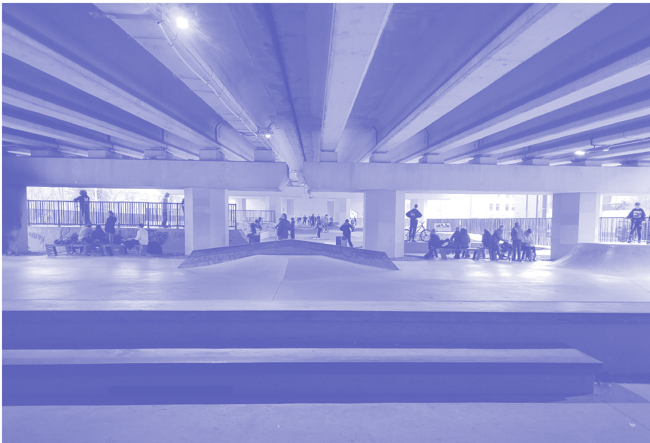
Рис. 1. Спот под Коломяжским путепроводом, октябрь 2021 г.

шум» в научной литературе? С каким релевантным исследованием города сюжетом мы здесь имеем дело? Возможно, это история превращения не-места, пространственных отходов строительства автомобильного шоссе, в место, обжитое горожанами и имеющее для них значение [Оже, 2017]. В какой-то мере это так. Но наш кейс скорее подрывает различие между не-местом и антропологическим местом у Марка Оже и вряд ли может быть проанализирован в этих терминах. Тогда речь о том, как горожане наконец-то получили право на город [Lefebvre, 1996]? Конечно, это так. Но нас здесь интересует не общий разговор о необходимости дать людям право на город, а исследование процессов, происходящих после того, как они это право в той или иной мере получили. Понятие «права на город» само по себе формально, оно указывает лишь на гипотетически реализуемую возможность, игнорируя социоматериальности практик задействования этого права, которые нас здесь интересуют прежде всего.