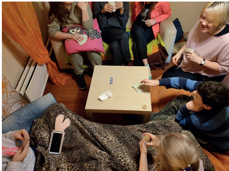
Рис. 4. Подростки и ведущие клуба обычно вместе играют в настольные игры