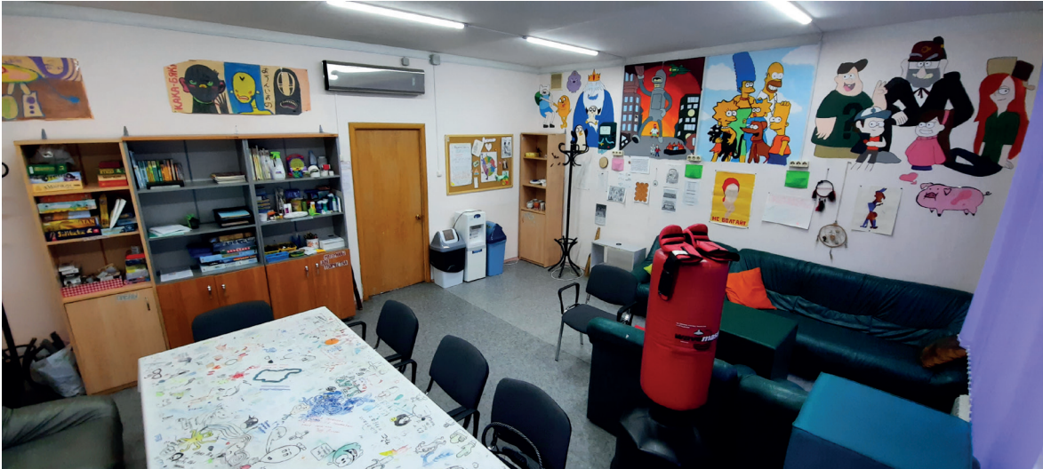
Рис. 1. Помещение клуба в Крылатском