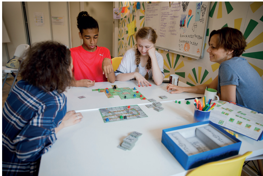
Рис. 5. В клубе всех принимают таким как есть

Н.Д. (Крылатское): По сути, Городской психолого-педагогический центр уже пытается масштабировать систему клуба в рамках города. Но это сложный процесс приведения клубов в некое единообразие. Очень важно много времени и ресурсов уделять подготовке клубных