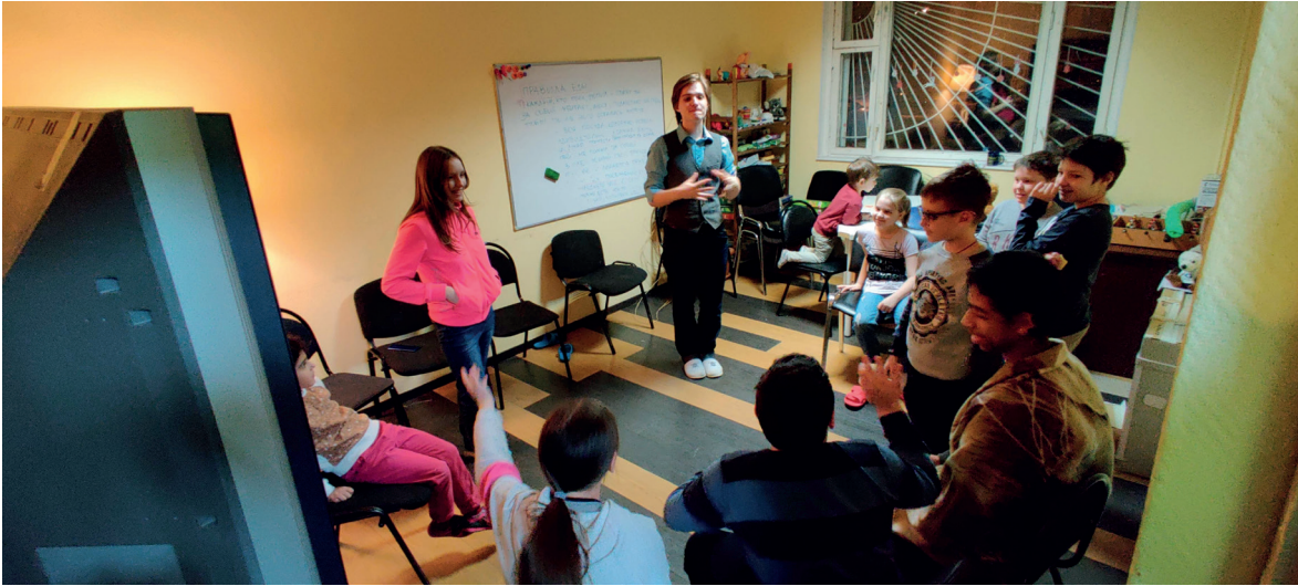
Рис. 3. В игре можно получить новые способы коммуникации, опыт проживания разных ситуаций