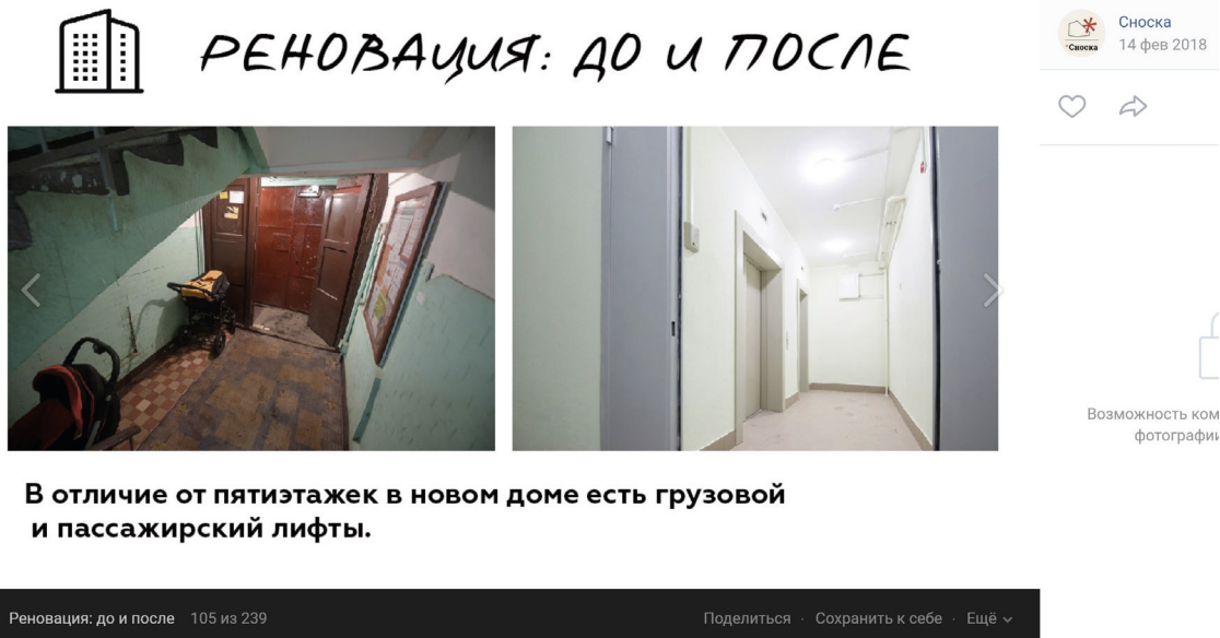
Рис. 1. Сравнение «до и после»